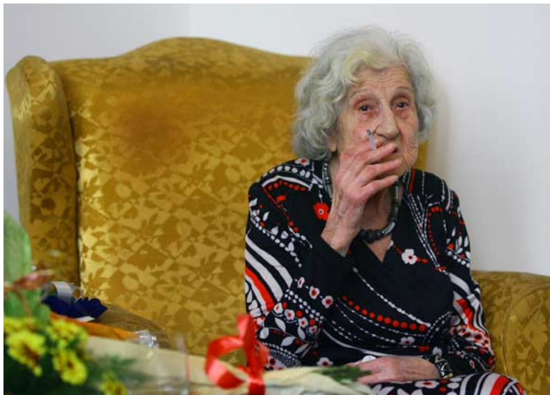
Макар и на 100 години прочутата балерина все още пуши.